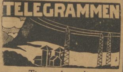
Tina s.s.k. sedjen

Resident Jacatra menta ka sakabeh soedagar beas di Jacatra djeung sawewengkonna soepaja sakabeh persediaan beas dilaporkeun, njaeta pikeun naloengtik pamandangan tina pasal kaajaan kadaharan.